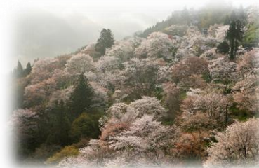
下千本の桜満開時