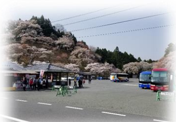
吉野山観光駐車場

駐車場から旅館歌藤までは徒歩5~7分程度です。美しい山の景色を眺めながらお越しくださいませ。