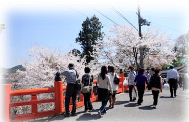
旅館歌藤近くの大橋